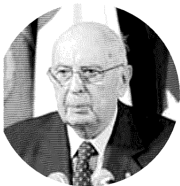
Il poster di Vassallo sulla torre di Acciaroli e, nel tondo, il presidente Napolitano