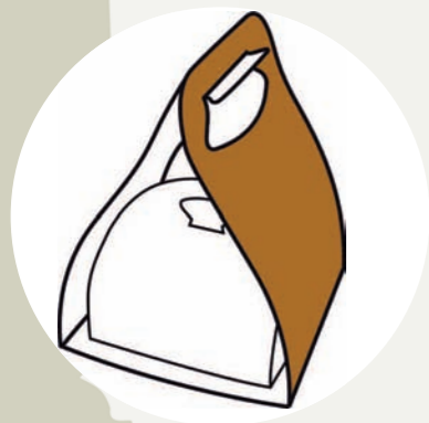
Il "doggy bag"