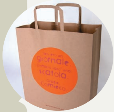
Shopper 10 e lode