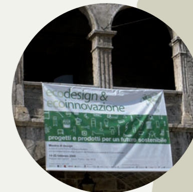
Il convegno ad Ascoli

La città di Reggio Calabria, a sorpresa, ha conquistato il titolo di "Regina italiana del riciclo" nel corso delle Cartoniadi Nazionali, che hanno coinvolto sei tra le principali città italiane: Milano, Roma, Bologna, Firenze, Palermo e – appunto – Reggio Calabria. La manifestazione, promossa nei mesi scorsi da Comieco, ha visto gli abitanti delle sei città competere a chi avrebbe incrementato di più la raccolta di carta e cartone rispetto allo stesso periodo dell'anno scorso. La vittoria è andata, come detto, a Reggio Calabria, che ha ottenuto un incremento di ben il 339%. La città calabrese si è aggiudicata il primo premio di 50.000 euro, destinato dall'amministrazione comunale al recupero di beni sottratti alla mafia.