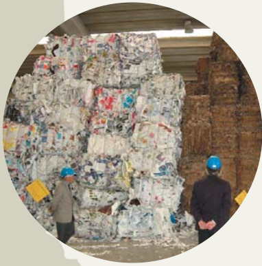
Visita a una cartiera