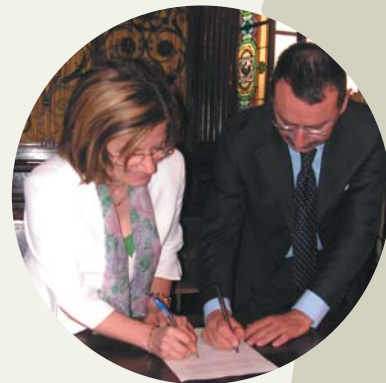
La firma dell'intesa a Torino

Riciclare carta, cartone e cartoncino fa bene al portafoglio degli italiani. Questa, in sintesi, la conclusione della ricerca sull'analisi costi-benefici commissionata da Comieco e realizzata da Agici-Finanza d'Impresa.