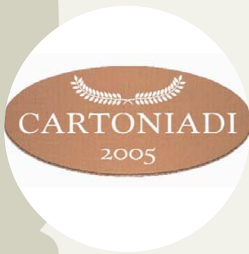
Il logo delle Cartoniadi