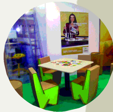
Il laboratorio "Cartopoli"