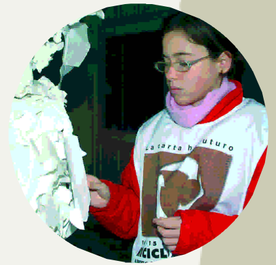
Un momento di RicicloAperto 2003

La terza edizione di RicicloAperto, il 14 e il 15 novembre scorsi, si è conclusa con grande successo. Si calcola che circa 300.000 persone abbiano visitato le mostre sul riciclo degli imballaggi cellulosici allestite nei 19 Ipermercati Coop che hanno aderito all'iniziativa; e che non meno di 25.000 persone (di cui circa 17.000 studenti delle scuole elementari, medie e superiori) abbiano visitato gli 85 impianti della filiera cartaria che hanno aperto per due giorni i propri cancelli per mostrare in concreto come avviene il riciclo della carta e del cartone. Cinque importanti Musei, infine, hanno offerto gratuitamente ai propri visitatori tour guidati nella storia della carta e laboratori didattici nei quali produrre la carta a mano.