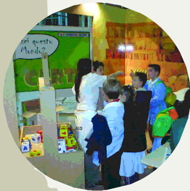
Lo stand Comieco a Ecomondo