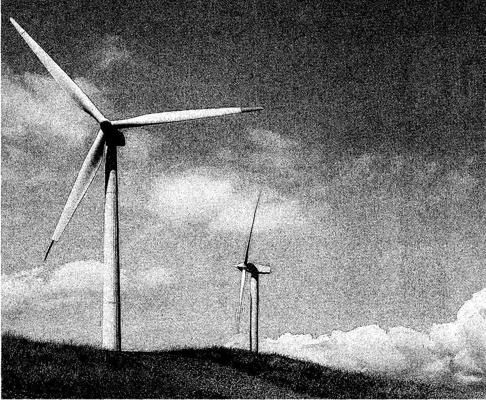
Energia eolica. Gli impianti hanno bassi costi di mantenimento e smantellamento e componenti riciclabili/riutilizzabili